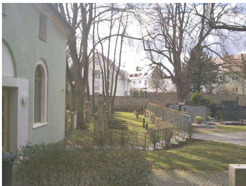
Jüdischer Friedhof von 1822 mit Blick Richtung Schillerstraße. Links das Tahara-Haus.

Bereits 1822 konnte nach langen Verhandlungen auf einem angrenzenden Gelände auch ein eigener Friedhof für die jüdische Bevölkerung Regensburgs mit Taharahaus zur Leichenwaschung und Wärterwohnung eingerichtet werden. Dieser wurde 1869 und nochmals 1926 erweitert. Probleme bereitete hier allerdings die Nähe zum westlich davon gelegenen Schießplatz, wegen der das Grundstück sonst eigentlich unverkäuflich gewesen wäre. Denn es lag genau hinter den Erdwällen, die als Kugelfang für den Schießplatz dienten. Deswegen wurden entgegen der üblichen jüdischen Sitte die der ersten Gräber auch in Nord-Süd-Richtung angelegt, damit die Grabsteine nicht von verirrtten Kugeln getroffen wurden. Dies geschah aber trotzdem wohl öfter, und es sind auch Klagen des Friedhofswärters über Lärm und Geschosse überliefert, die durchs Fenster seiner Wohnung flogen und in einem Blumentopf stecken blieben!