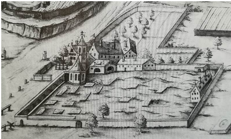
Siechenhaus St. Lazarus. Mit Kirchlein, Wohnhaus für den Geistlichen, Spital und Wirtschaftsgebäude sowie Friedhof. Federzeichnung von Hans Georg Bahre, 17. Jh

1532 – zehn Jahre bevor Regensburg offiziell protestantisch wurde – hatte die evangelische Gemeinde dann im Süden vor dem Peterstor bei der alten Kirche Weih St. Peter Grund für einen gänzlich neuen Friedhof erworben, weil die Gottesäcker an den alten Siechenhäusern wohl dennoch aus allen Nähten platzten. Hier entstand dann bis zu seiner Auflösung Ende des 19. Jahrhunderts der zentrale evangelische Bestattungsort für die Untere Stadt, während der Lazarusfriedhof im Westen, der 1563 dafür auch erweitert wurde, der der Bestattungsort für die protestantischen Bürger der Oberen Stadt wurde – analog den evangelischen Kirchengemeinden bei der Neupfarr- und der Dreieinigkeitskirche.