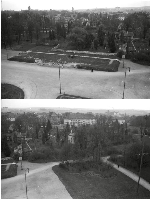
Aufnahmen vom Stadtpark – aus der Zeit vor 1940, vermutlich vom Dach der Halle der Kreisausstellung – Darauf noch gut zu sehen die ehemaligen Friedhofsmauern, die katholische Friedhofskapelle von 1834 und das Leichenhaus.