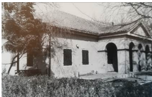
Ehem. Leichenhaus des Lazarus-Friedhofs von 1831, heute Kindergarten im Stadtpark Prüfeninger Straße.

Das erste Regensburger Leichenhaus entstand freilich erst im Zusammenhang mit der Cholera-Epidemie von 1831, für die die Stadt große Vorkehrungen getroffen hatte, die dann aber wider Erwarten ausblieb. Das Leichenhaus mit Leichensaal, Sezierraum und Wärterstube lag zwischen dem katholischen und dem evangelischen Friedhofsteil und musste trotz anfänglicher Proteste von beiden Konfessionen genutzt werden. Heute beherbergt es den Stadtparkkindergarten.